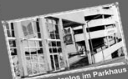
Parken kostenlos im Parkhaus in der 2. Etage

Auf unseren 200 gemütlichen Sitzplätzen finden auch Familienfeiern, Betriebsfeste und Veranstaltungen aller Art reichlich Platz, um sich von uns kulinarisch verwöhnen zu lassen.