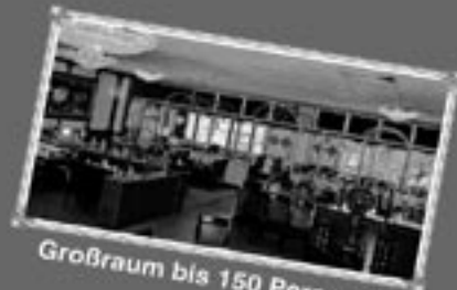
Großraum bis 150 Personen

Für Geburtstagskinder ist das Essen kostenfrei (ab 4 Personen) bitte Ausweis vorlegen!