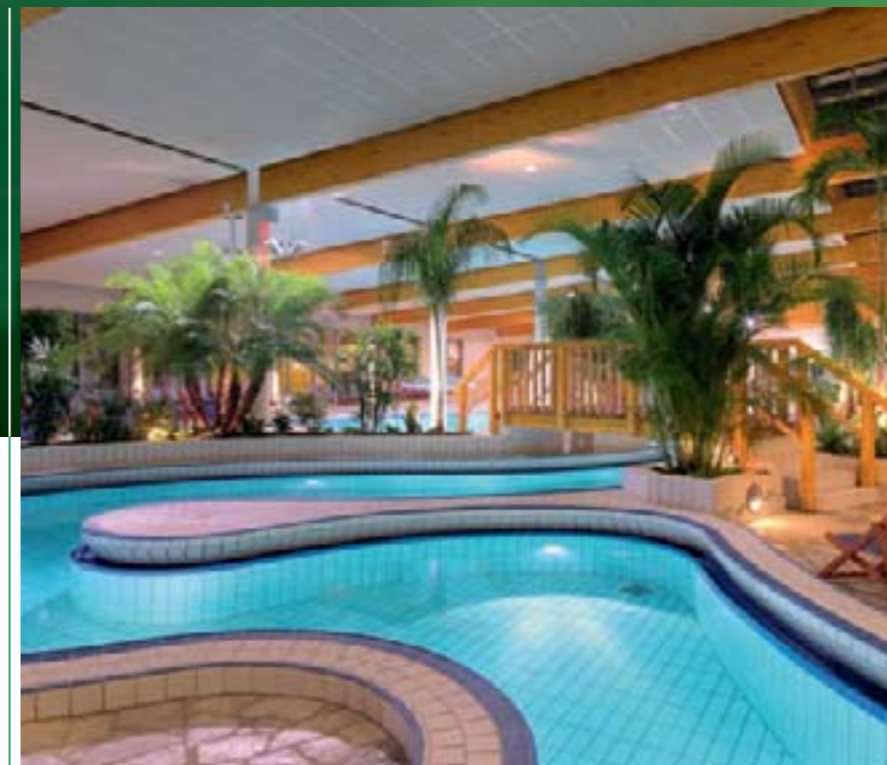
Ganzjähriges Urlaubsfeeling: Das Thermal- und SpaBad „fürthermare“ – gespeist aus der Kleeblatt-Heilquelle.