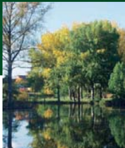
Erholung pur: Der Fürther Stadtpark.