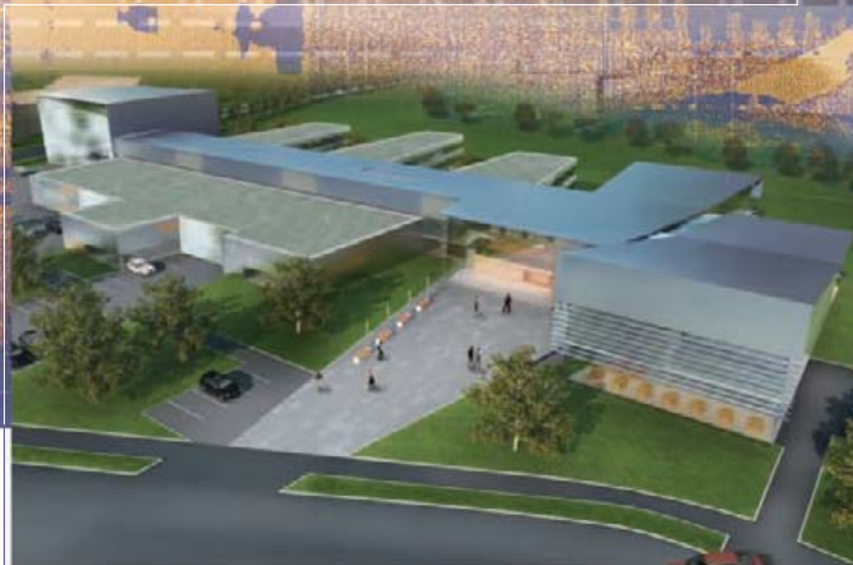
Modell des geplanten Fraunhofer-Gebäudes im Golfpark.

Der Standort Fürth spannt den Bogen zwischen traditionellen Werten und fortschrittlichem Denken. Als liebenswerter Lebensraum und innovationsreicher Wirtschaftsraum schlägt die Stadt gleichermaßen die Brücke in die Zukunft: Fürth ist in Bewegung, um die Zeichen der Zeit in ein adäquates Gefüge aus Architektur, Infrastruktur und Kultur zu übersetzen, das neuen Unternehmensgenerationen gerecht wird und deren Mitarbeitern hohe Lebensqualität verspricht. Die zeitgemäße Orientierung der Stadt findet ihre Bestätigung in den zahlreichen Gründungen der letzten Jahre und der Ansiedlung vieler zukunftsorientierter Branchenzweige.