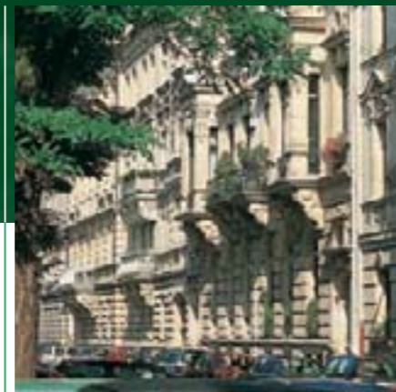
Jugendstil par excellence: Hornschuchpromenade.