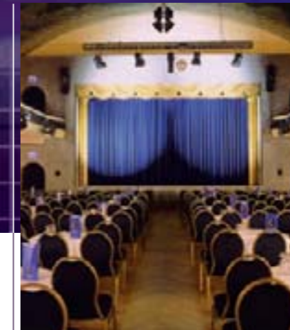
Der Publikumsmagnet, weit über die Region hinaus: Comödie Fürth.