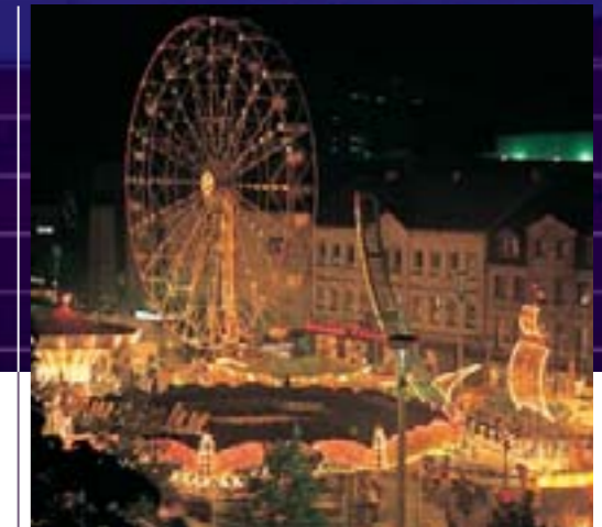
„Königin der Fränkischen Kirchweihen“: Die Fürther Michaeliskirchweih.

Wo tatkräftig am Fortschritt gearbeitet wird, darf die Freizeit nicht zu kurz kommen.