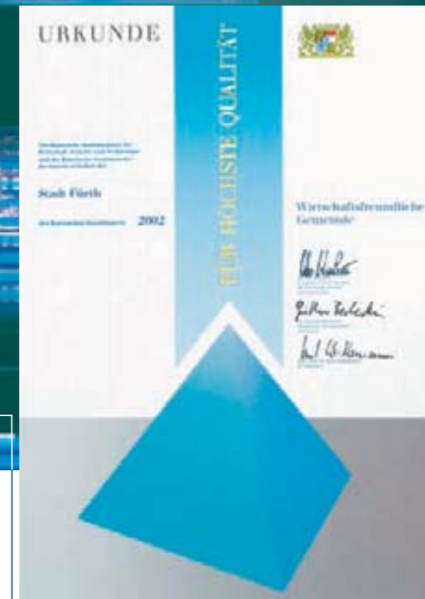
Bayerischer Qualitätspreis: Fürth zählt zu den wirtschaftsfreundlichen Gemeinden in Bayern.