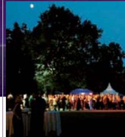
Prächtige Kulisse für den größten Freiluftballsaal Bayerns: Der Sommerachtsball im Stadtpark.