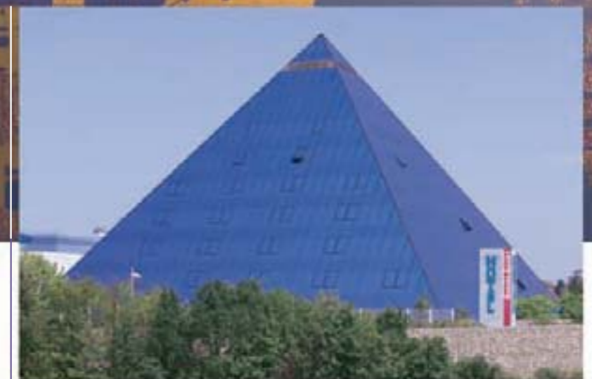
Wahrzeichen des modernen Fürth: Kongress- und Tagungshotel Pyramide.