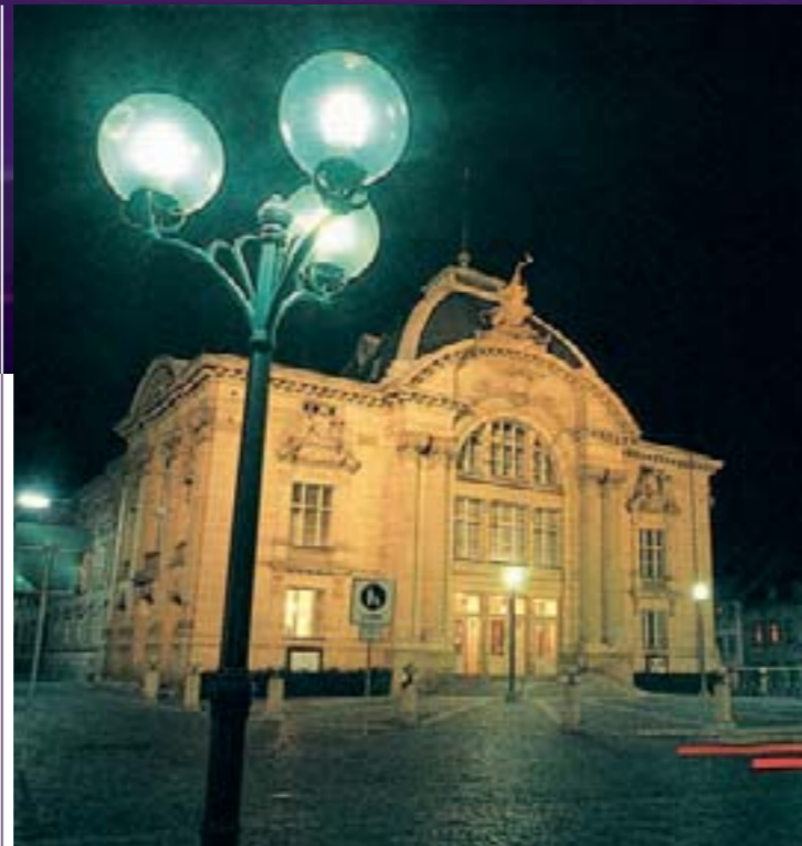
Inszenierungen im großen Stil: Stadttheater Fürth.