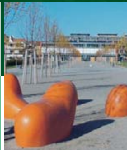
Viel Platz auf 10 Hektar: Der neue Südstadtpark.