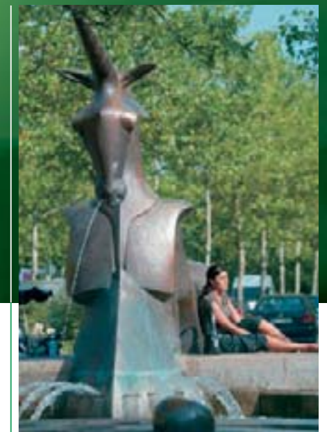
Oase zum Energietanken: Paradiesbrunnen auf der Fürther Freiheit.