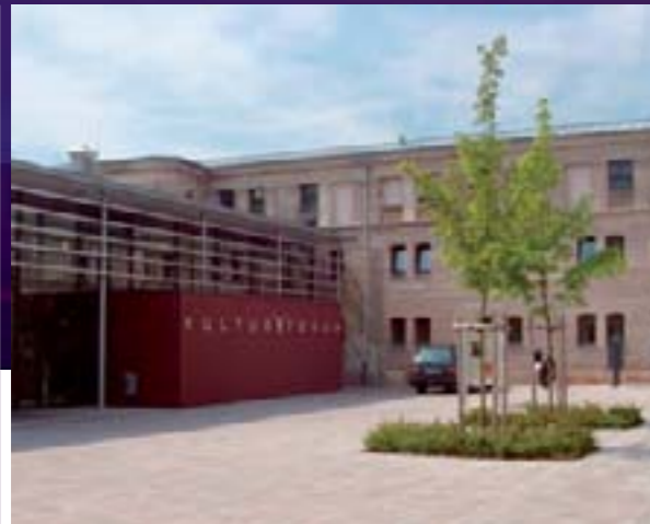
Partnerschaft zwischen Stadt, Wirtschaft und Kultur: Das Kulturforum.