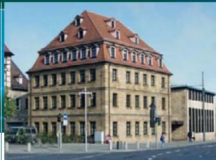
Zentrale Anlaufstelle für Gewerbetreibende und Investoren: Das Wirtschaftsrahus.

Die Marktwirtschaft entwickelt sich rasant. Neue Märkte, neue Fertigungsmethoden, neue Medien, neue Bedürfnisse. Um dem Tempo dieser Zeit und dem daraus erwachsenden, immer kurzfristigeren und aktuelleren Informationsbedarf gerecht zu werden, stehen Ihnen im Wirtschaftsreferat der Stadt Fürth kompetente Ansprechpartner zur Verfügung. Ob Betreuung ortsansässiger Unternehmen, Beratung von ExistenzgründerInnen oder Informationen für potenzielle Investoren – wir haben immer ein offenes Ohr für Ihre Anforderungen. Unsere Spezialisten lotsen Sie durch den Behördenschwungel, beraten und unterstützen Sie umfassend, verkürzen die Amtswege und geben Ihnen Auskunft über Finanzierungshilfen. Keine Frage bleibt ungeklärt – kompetente und engagierte Beratung garantiert. Nicht umsonst wurde die Serviceorientierung der Stadtverwaltung Fürth mit dem Bayerischen Qualitätspreis als „Wirtschaftsfreundliche Gemeinde“ ausgezeichnet. Fordern Sie uns und nutzen Sie unser Dienstleistungsangebot.