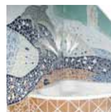
Badezimmer MOSAİK DELPHIN