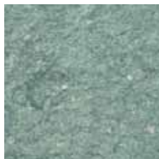
Anröchter GEFLAMMT & GEBÜRSTET