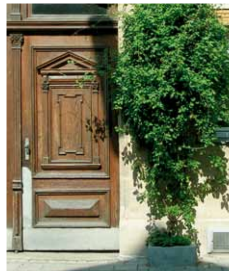
Grüner Blickfang in der Theaterstraße

An zahlreichen Ecken der Innenstadt wird im Frühling wieder zartes Grün aus dem Boden sprießen und die Häuserwände erklimmen – von Vielen geliebt und gepflegt (manchmal auch mit scharfem Pfeffer gegen allzu neugierige Hundenasen). Die Rede ist hier von den Hauseingangsbegrünungen – ein Projekt der Sozialen Stadt seit 2002, initiiert von engagierten Innenstadtbewohnerinnen und -bewohnern, als Förderprojekt umgesetzt von der Stadt Fürth und koordiniert vom Quartiersmanagement.