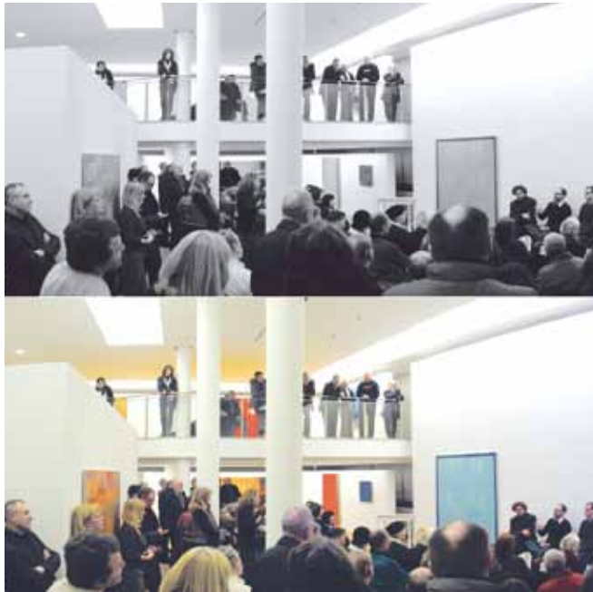
Stichwort KUNST, eine Veranstaltung des Kulturring C in der kunst galerie fürth

Der/die KünstlerIn muss professionell arbeiten. Ein künstlerischer Werdegang ist hilfreich, das heißt eine künstlerische Ausbildung, Ausstellungsverzeichnis oder erhaltene Kunstpreise müssen nachgewiesen werden. Der/die KünstlerIn muss entweder aus Fürth sein oder hier ein Atelier oder einen nachvollziehbaren Bezug zur Stadt haben. Ausgeschlossen sind Kunsthandwerk und Design. Die Bewerbung sollte einen Lebenslauf und ein Ausstellungsverzeichnis