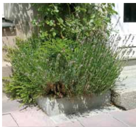
Beispiel für eine schöne Unterpflanzung der Hauseingangsbegrünungen

Den Einbau von Pflanzsteinen in den Gehwegbelag und die Montage von Rankseilen übernimmt die Stadt, der Eigentümer ist nur für