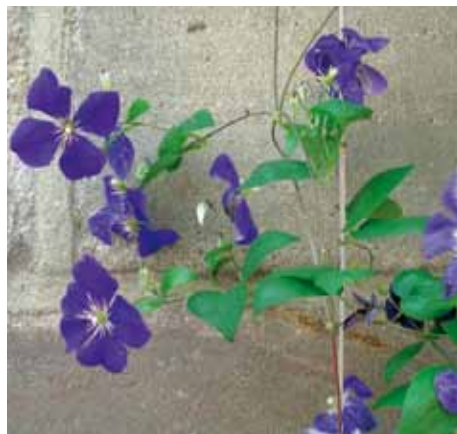
Eine rankende Waldrebe für Wände im Halbschatten