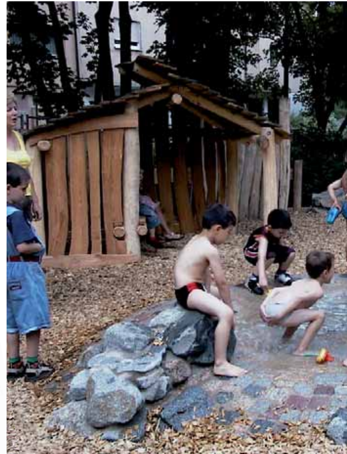
Mitte: Wasserspielbereich im städtischen Kindergarten Badstraße Oben: Abbruch des Vorgängerbaus im Kindergarten Badstraße